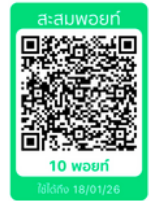
ตัวอย่าง QR code